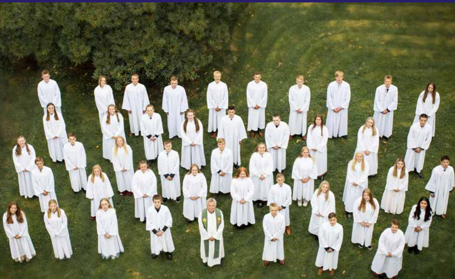
Konfirmanter i Flekkefjord Kirke 2020

KONFIRMANTER ► ANDAKT ► MIN SALME ► KORONAHØST VI GÅR TIL KIRKE ► SOMMERPRAT ► DIAKONENS HJØRNE